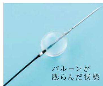
バルーンが 膨らんだ状態